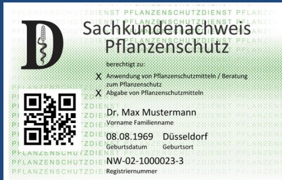
Muster eines Sachkundenachweises

Bis zum 26.11.2015 genügen als Nachweis der Sachkunde der erfolgreiche Abschluss einer das Fachgebiet Pflanzenschutz tangierenden Berufsausbildung oder eines entsprechenden Studiums (für Wald z. B. Forstwirt bzw. Diplomforstwirt / Bachelor in Forstwissenschaften) oder eine bestandene Sachkundeprüfung. Nach diesem Datum erfolgt der Nachweis der Sachkunde über die Sachkundenachweiskarte , welche bei der zuständigen Landesbehörde (z. B. in Sachsen das LfULG, in Brandenburg das LELF) zu beantragen ist.